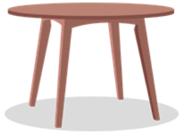
En las mesas

El espacio de la biblioteca CRA cuenta con un aforo de 25 personas.